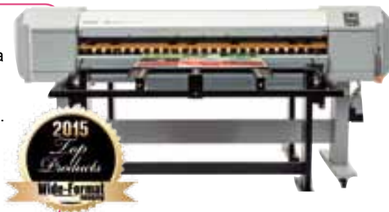
ValueJet 1626UH е 165 см широк LED UV хибриден принтер, който

осигурява висококачествени отпечатъци върху широка гама от твърди материали и обекти, включително ABS, PC, PE, PET, PMMA (акрил), PP, PS, PVC, непромазан Tyvek® и стъкло. Отпечатаните с бяло дизайн върху прозрачни материали се открояват, а с лака можете да създавате впечатляващи продукти с частичен лак.